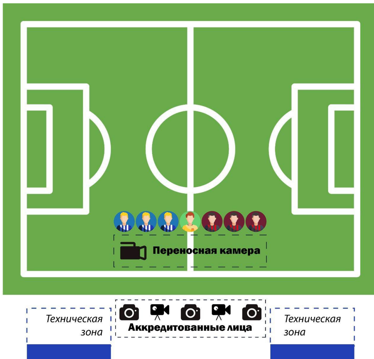
Схема размещения участников Матча, камеры Основного вещателя и аккредитованных лиц перед началом Матча